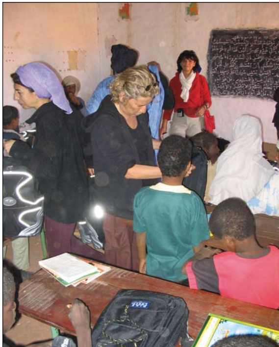
L'heure de la distribution dans l'école de Tifoujar